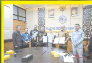
UNP Bersinergi dengan PKBI Hadapi Tantangan Kependudukan Indonesia di Masa Depan