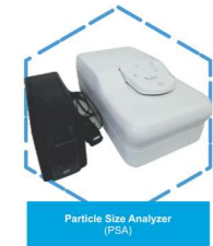
Particle Size Analyzer (PSA)