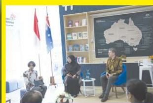
UNP dan Yayasan Jantung Indonesia Luncurkan Klub Jantung Sehat DWP UNP, Dukung Gaya Hidup Aktif dan SDGs