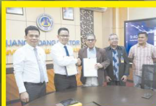
Resmi Jalin Kerja Sama Universitas Negeri Padang (UNP) dan Universitas PGRI Silampari (Unpari) Sumatera Selatan Tandatangani Nota Kesepahaman