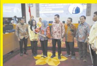
Kuliah Umum bersama Staff Ahli Menteri Ekonomi Kreatif Republik Indonesia