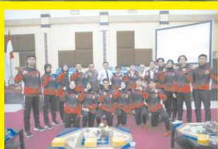
Rektor UNP dan Plt Kepala Dinas Pemuda dan Olahraga Sumbar Lepas kontingen UNP untuk mengikuti Pekan Olahraga Mahasiswa Nasional (POMNAS) XIX tahun 2025