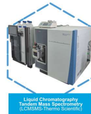
Liquid Chromatography Tandem Mass Spectrometry (LC-MS/MS-Thermo Scientific)