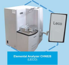
Elemental Analyzer CHN828 (LECO)