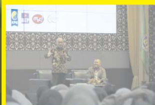
Gramedia Gelar "Lakukan Kaajian Literasi & Semesta Buku" di UNP, Perkuat Akses dan Budaya Baca Lewat Kolaborasi Kampus dan Komunitas