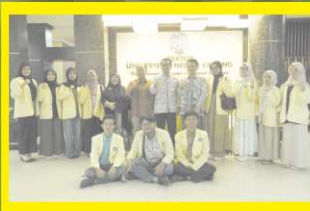
Rektor UNP Lepas Mahasiswa Program Internasional ke Malaysia dan Thailand_ Bawa Misi Akademik dan Budaya