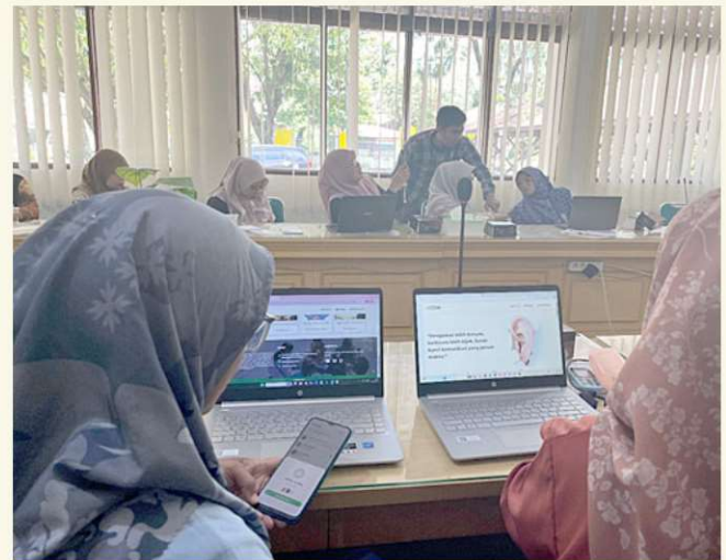
Para dosen dan mahasiswa PLB serta guru SLB menguji langsung fitur ELSAEDU dalam workshop pelatihan internal.

“Semua riset itu saya dasarkan pada kebutuhan nyata di lapangan. Saya ingin setiap penelitian bukan hanya berhenti di jurnal, tapi bisa dirasakan manfaatnya oleh guru dan siswa,” tuturnya.