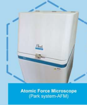
Atomic Force Microscope (Park system-AFM)