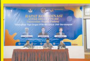
Rapat Koordinasi Tiga Organ PTN BH Universitas Negeri Padang