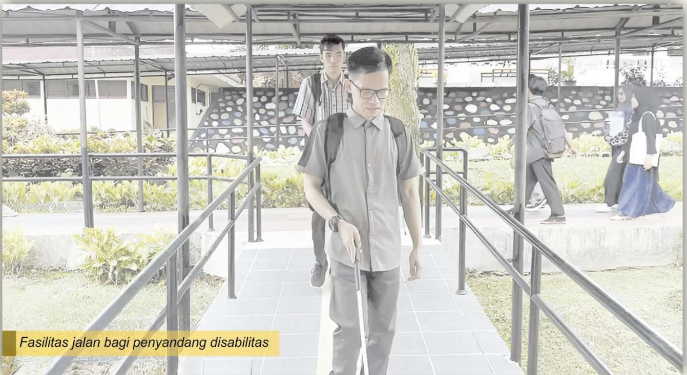
Fasilitas jalan bagi penyandang disabilitas

Pendidikan inklusif merupakan komitmen global dan nasional dalam memastikan hak pendidikan bagi semua warga negara, tanpa membedakan ras, etnis, suku dan agama termasuk penyandang disabilitas. Universitas Negeri Padang (UNP) sebagai salah satu universitas negeri terkemuka di Indonesia telah menunjukkan upaya konkret dalam mewujudkan pendidikan inklusif dan berdampak bagi semua mahasiswa