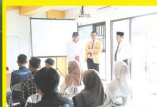
Rektor dan Pimpinan UNP Monev Perkuliahan perdana mahasiswa S1 dan Diploma UNP