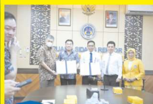
Fakultas Pariwisata dan Perhotelan, Universitas Negeri Padang (FPPUNP), resmi menandatangani Memorandum of Understanding (MoU) dan Memorandum of Agreement dengan Batam Opus Bay