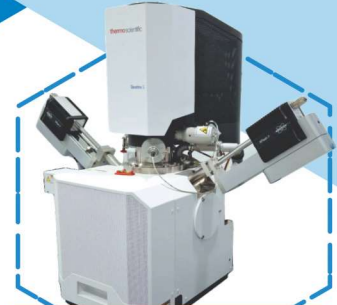
Field Emission Scanning Electron Microscope (FE-SEM-Thermo Scientific) (EDS, Elemental Mapping, SE, BSE, STEM, ESEM, Maps Mineralogy)