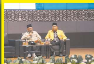
Kepala Badan Penyelenggara Haji Beri Kuliah Umum di UNP, Bahas Tranformasi Penyelenggaraan Ibadah Haji dan Kontribusi Kampus