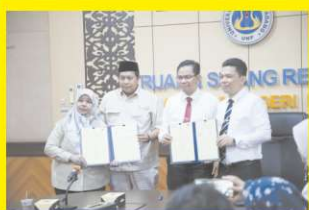
Kesepakatan Kerjasama antara Direktorat Peningkatan Kapasitas Pekerja Migran Indonesia dengan Universitas Negeri Padang