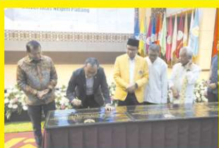
Menteri Pendidikan Tinggi, Sains, dan Teknologi Resmiakan 8 Gedung Baru Universitas Negeri Padang