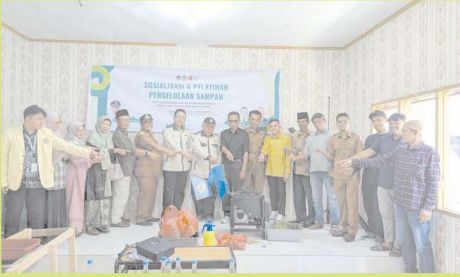
Tabek Panjang, Agam — Mahasiswa Universitas Negeri Padang (UNP) yang tergabung dalam Kuliah Kerja Nyata (KKN) Tematik 2025 di Nagari Tabek

Panjang, Kecamatan Baso, Kabupaten Agam, menunjukkan komitmen nyata dalam pengabdian kepada masyarakat dengan menyerahkan satu unit mesin pencacah sampah kepada Pemerintah Nagari Tabek Panjang, Selasa (1/7/2025).