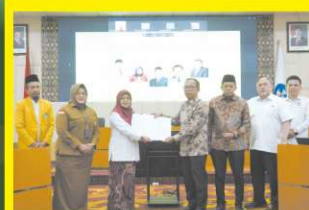
Memperkuat Ekosistem Halal melalui Kampus UNP Selenggarakan FGD tentang Layanan Jaminan Produk Halal