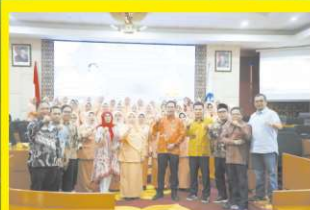
Pengukuhan Dharma Wanita Persatuan Perguruan Tinggi Negeri dan DWP LLDIKTI se Indonesia.