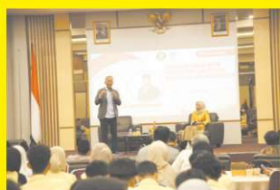
Beri Kuliah Umum di UNP, Prof. Saldi Isra Soroti Pentingnya Literasi Hukum.